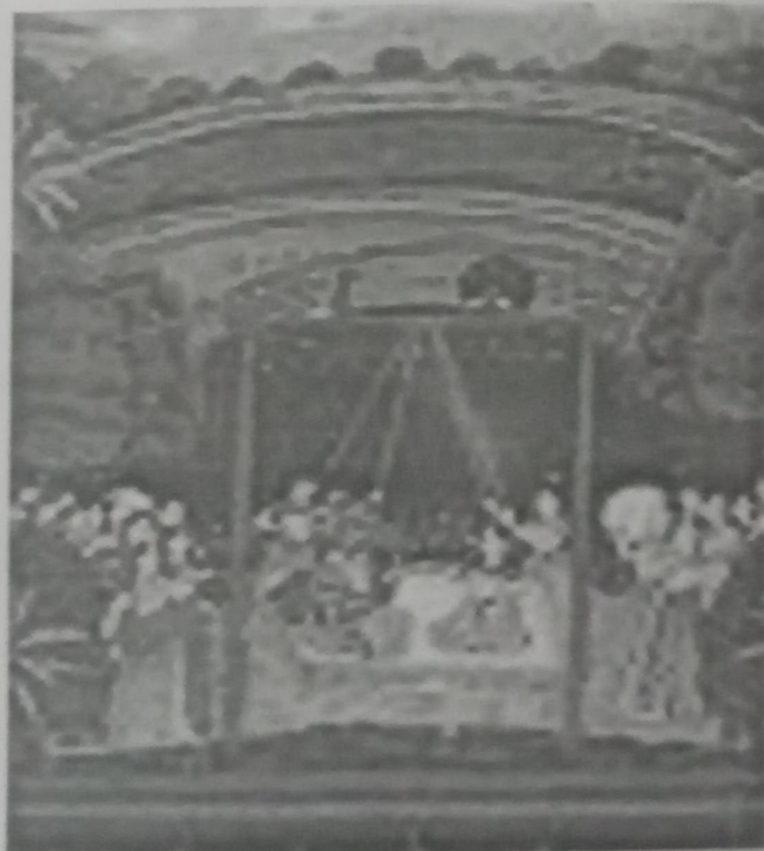
राग भैरव - ध्यान चित्र