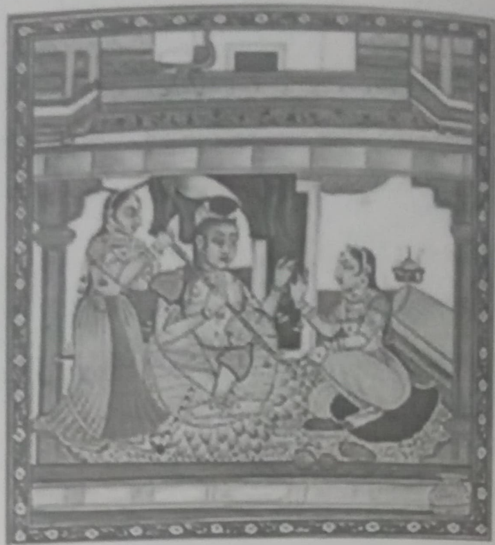
राग भैरव - ध्यान चित्र